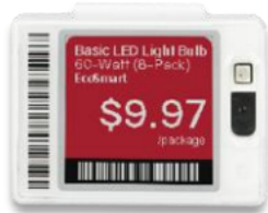
SmartTAG HD S Especial para pingente tipo blíster. Polegadas: 1,6