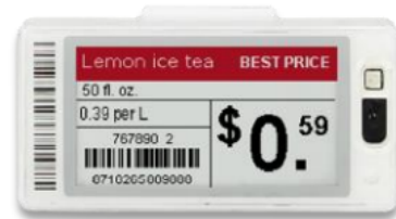
SmartTAG HD M+ Etiqueta para o expositor Polegadas: 2,2